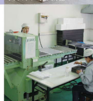
スーパーカッター