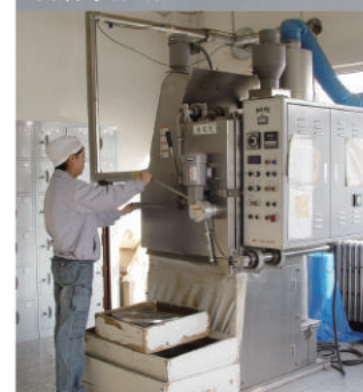
デフレッシャー(バリ取り機)