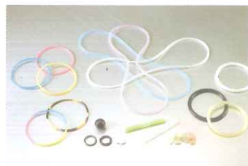
新素材製品（透光性ゴム・トルマリン入り・低比重ゴム・高比重ゴム）