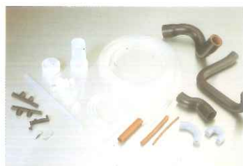
その他 (エラストマー製品・フッ素樹脂製品・チューブ・曲り管)