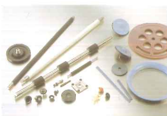
複合製品 (ゴム+金属・ゴム+樹脂・ゴム+フッ素樹脂)