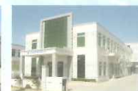
名 称 惠坊伊奈霸精密橡膠制品有限公司