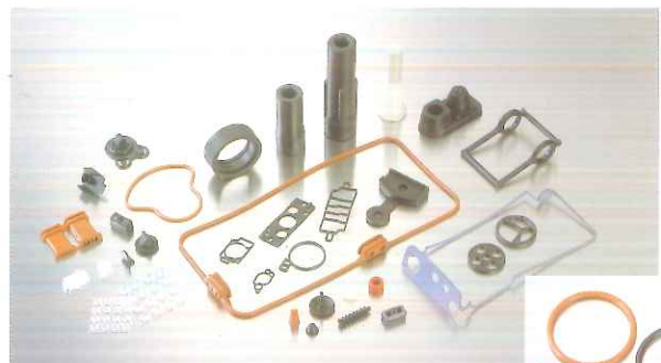
精密特殊パッキング

イナバグループ独自の品質基準をもち製品作りをしています。 それは現代メカトロニクスと熟練技術の融合に狙いがあります。 お客様のニーズやウオントにに応えるには、イナバの専門性を 最大限に発揮する必要があるからです。