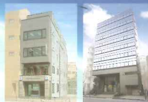
本社・管理本部・大阪支店

本社・管理本部 〒550-0003 大阪市西区京町堀3丁目3-15 TEL(06)6448-0335(代表) FAX(06)6448-2169 大阪支店 〒550-0003 大阪市西区京町堀3丁目3-15 TEL(06)6448-3645(代表) FAX(06)6441-4986 東京支店 〒102-0072 東京都千代田区飯田橋1丁目12-7(飯田橋センタービル3F) TEL(03)3263-9521(代表) FAX(03)3234-0626 鳥取営業所 〒680-0911 鳥取市千代水1丁目63番地 TEL(0857)26-5591(代表) FAX(0857)27-1941 北九州営業所 〒807-0851 北九州市八幡区西永大町1-1-15 TEL(093)691-3110(代表) FAX(093)691-3119 鳥取工場・ 開発センター 〒680-0911 鳥取市千代水1丁目63番地 TEL(0857)26-5592(代表) FAX(0857)27-1966 東京工場 〒340-0831 埼玉県/川崎市大幸南後谷字屋敷831-2 TEL(048)997-6101(代表) FAX(048)997-6104 大阪工場 〒74-0052 大阪府大東市新北町6-5 TEL(072)872-8381(代表) FAX(072)871-8660 伊奈覇香港有限公司 香港九龍紅磡都會道10号都会大厦12楼1207-08室 TEL(852)2314-0555 FAX(852)2314-0755 INABA RUBBER (THAILAND)CO.,LTD. KAMOL SUKOSOL BUILDING 12th FLOOR, UNIT D 317 SILOM ROAD, BANGRAK, BANGKOK 10500 TEL(66)2-635-5157 FAX(66)2-635-5155