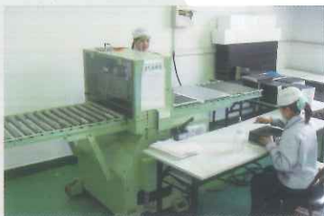
スーパーカッター