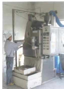
デブレッシャー（バリ取り機）